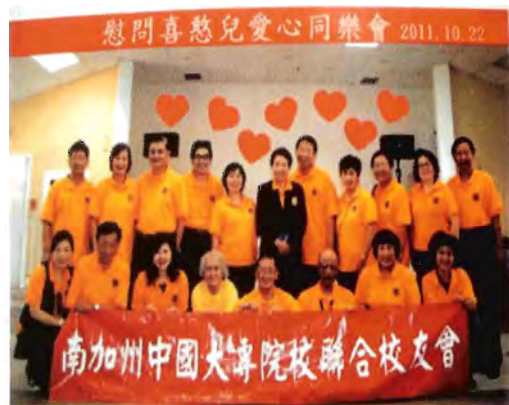
南加州中國大專院校聯合校友會舉辦慰問喜慈兒活動