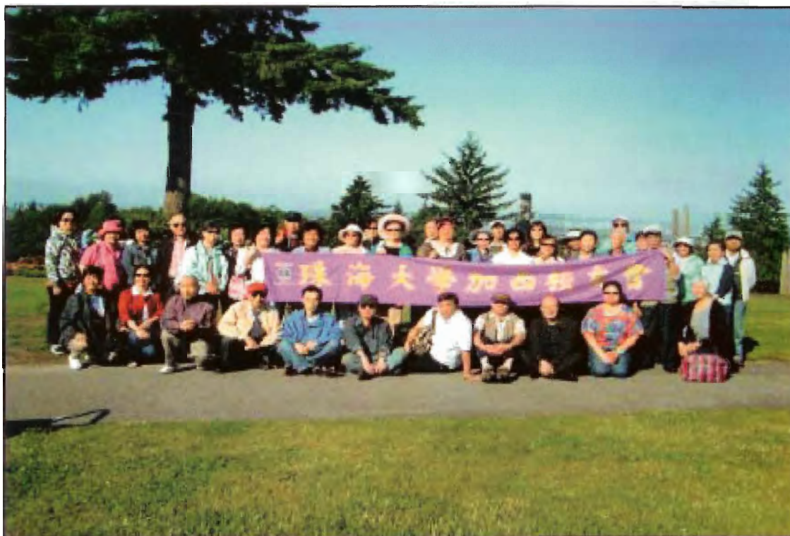
集體合照於本拿比山