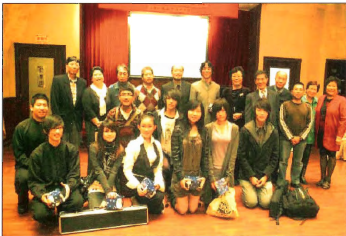
表演嘉賓與眾理事合照