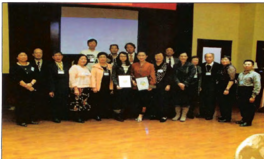
表演嘉賓與眾理事合照