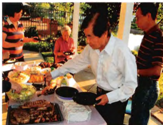
校友在Valencia Bridgeport舉行燒烤活動