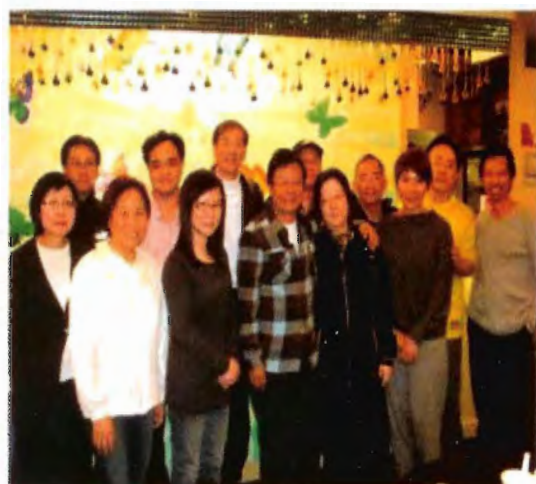
毓民與新傳系校友聚會時合照