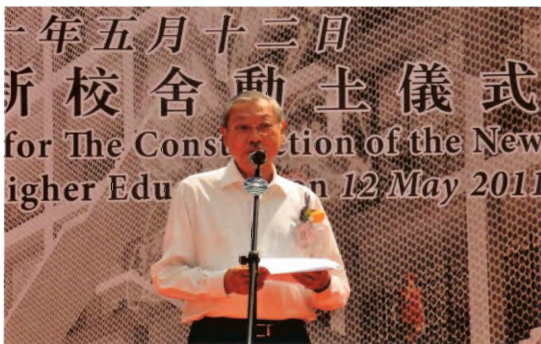
教育局局長孫明揚太平紳士主持新校舍動土儀式