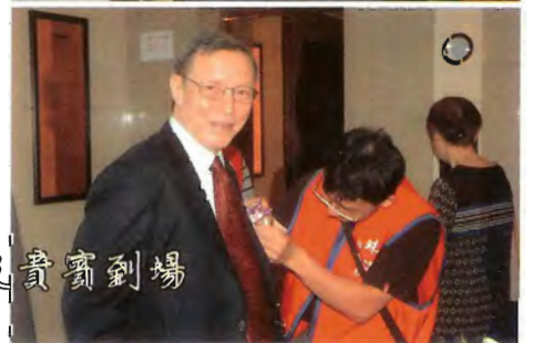
師長、校友及貴賓到場